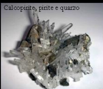
Calcopirite, pirite e quarzo