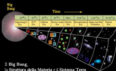
Il Big Bang, la Struttura della Materia e il Sistema Terra