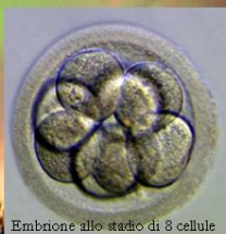
Embrione allo stadio di 8 cellule