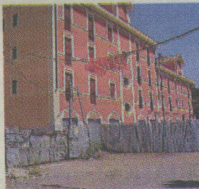
Case Ater Oltre 100 alloggi saranno assegnati _DNEWS