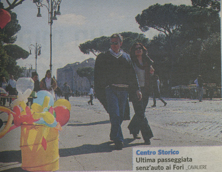
Centro Storico Ultima passeggiata senz'auto ai Fori _CAVALIERE